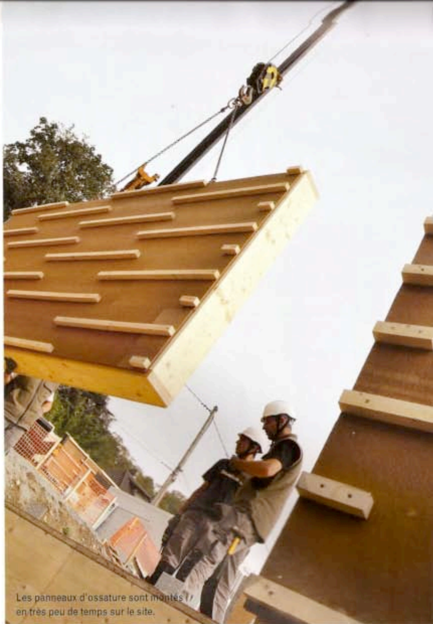
Les panneaux d'ossature sont montés en très peu de temps sur le site.

Un poêle à pellets sera disposé dans la salle de conférences, située au premier étage. Combiné à 10 m 2 de panneaux solaires thermiques recouvrant la façade du balcon, le système produira l'eau chaude sanitaire. Un appoint de chaleur sera distribué par un sèche-serviettes dans chaque salle de bains et un radiateur par chambre. Le bois énergie, l'un des axes de développement du territoire de Seine-Aval, est ainsi largement mis en avant.