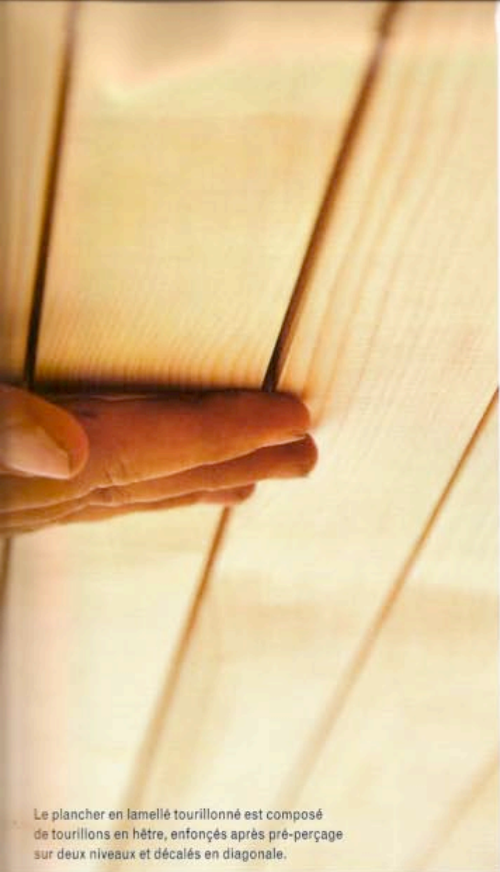
Le plancher en lamellé tourillonné est composé de tourillons en hêtre, enfoncés après pré-perçage sur deux niveaux et décalés en diagonale.